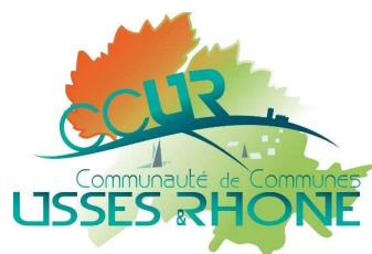
Table des sigles et contacts