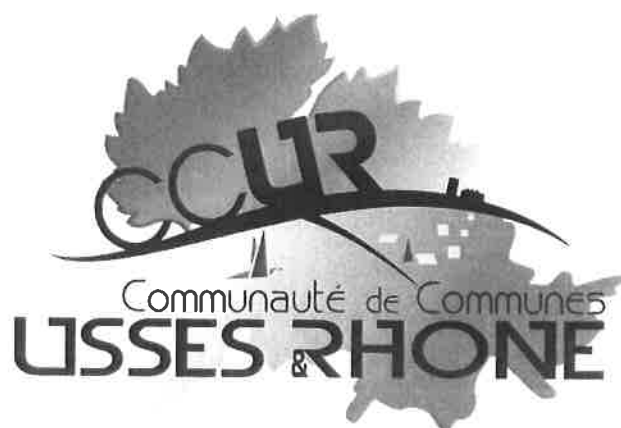
Schéma Cohérence Territoriale Communauté de Communes USSES et RHÔNE